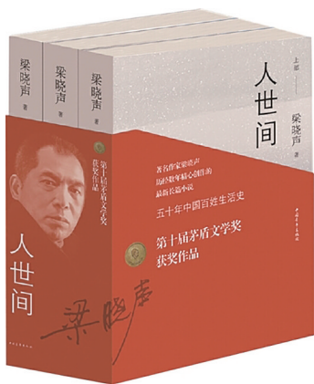
《人世间》梁晓声 著 中国青年出版社

《人世间》作为央视的重头大戏，一开播就火上了热搜。随着剧情的发展，丰富真实的剧情里饱含的温情和善意，演员栩栩如生、自然生动的演技吸引了各个年龄层的观众，获得了高分评价。这部让无数人留下感动泪水的大剧改编自茅盾文学奖获得者、著名作家梁晓声的同名小说《人世间》(三卷本)。