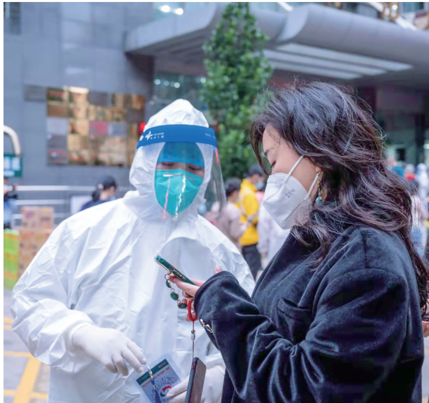
医护人员指导市民填报信息。

医护人员也提醒广大市民,疫情当前,出门要戴口罩,回家要勤洗手,做好个人卫生、家庭卫生,避免到人群密集场所活动,助力疫情防控。