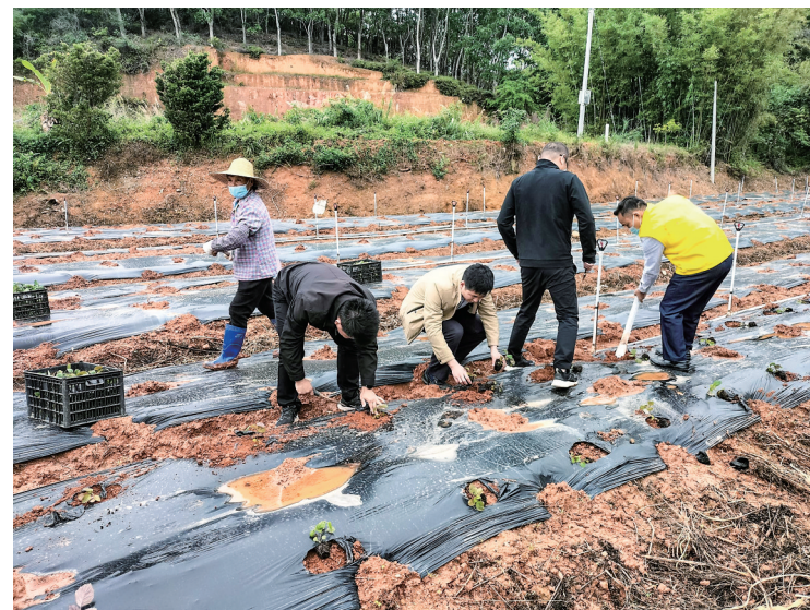
干群齐心协力种植藿香苗。

茂名晚报讯 记者黄昌明 四月初,一场小雨刚过,高州市南塘镇彭村村登山公园西面路边的田地上,一派热火朝天的劳动景象。镇、村两级干部以及乡村振兴驻镇帮镇扶村工作队队员、村民一起齐心协力种植藿香,他们有的挖坑、有的运苗、有的培土,大家热情高涨,完全不顾雨后泥泞的土地把鞋子和裤脚弄脏。