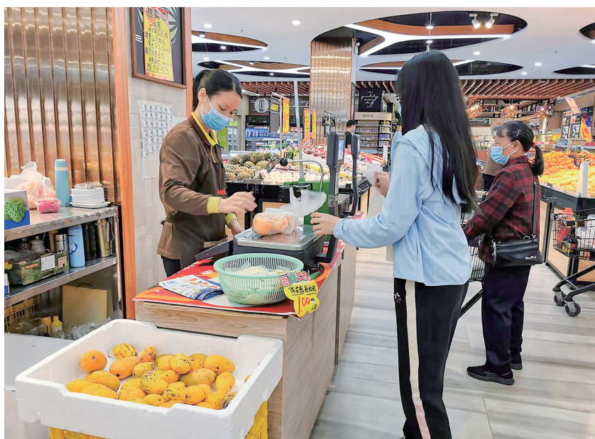
往日的生活秩序回来了。

昨天10时,附近的群众陆续来到“福乐佳”这里购物。超市内水果区、蔬菜区、豆制品区、肉类区都供应充足,群众有序挑选所需的物资。“我们终于能