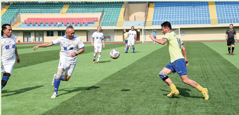
比赛现场。

茂名晚报讯 记者黄楚凡 通讯员叶志晟 为进一步丰富群众文化生活,推动电白区全民健身运动的深入开展,提高足球运动水平,展示电白广大市民群众良好的精神风貌,助推电白创建文明城市活动深入开展,电白区文化广电旅游体育局5月1日至4日,在电白区体育公园足球场,举办2022年电白区业余足球邀请赛(第二季)。共有4支足球队参加角逐。