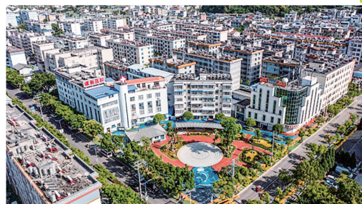
改造后的桂峰小区一景。