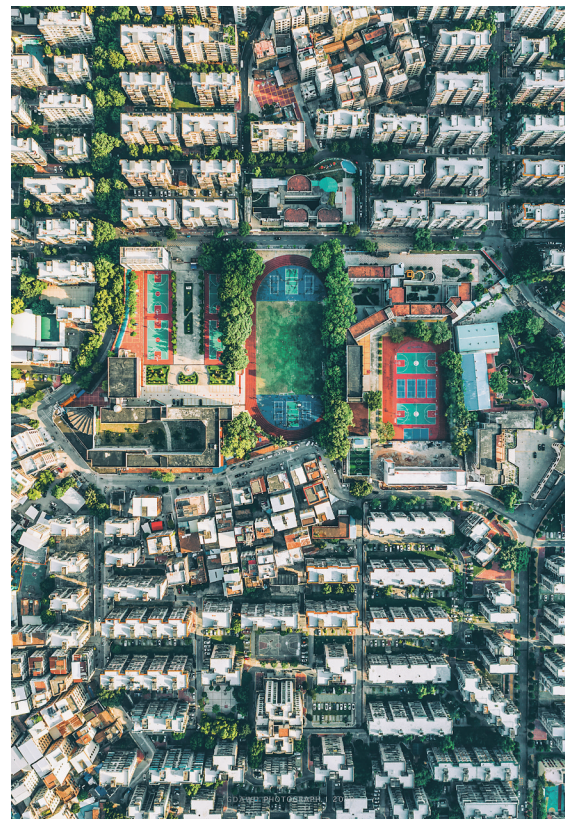
▲ 航拍茂名的大街小巷。