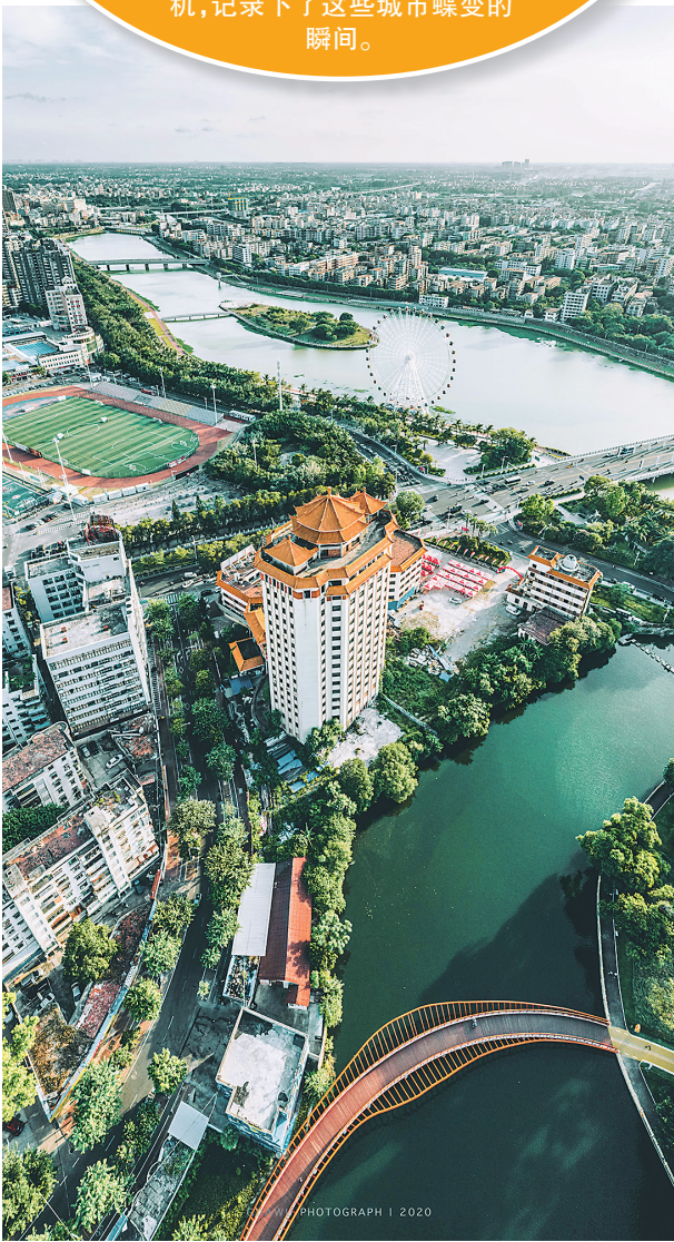
▲ 航拍茂名中心城区。