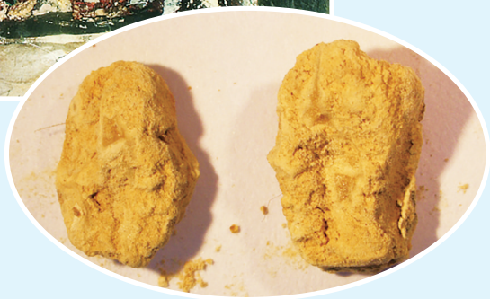
▶这是取自鎏金四天王盃顶银宝函的1号样品。