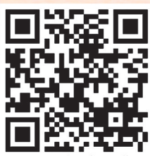
扫码定制茂名(电白)荔枝

为推广茂名荔枝,助力荔农增收,增强荔农的获得感、幸福感,电白区启动“助力茂名美荔 尽享家乡甜蜜”茂名(电白)荔枝定制活动,助力荔枝销售。本次定制活动分为霞洞上河古荔园百年以上古荔枝定制(45棵)和美荔定制(4000棵)。