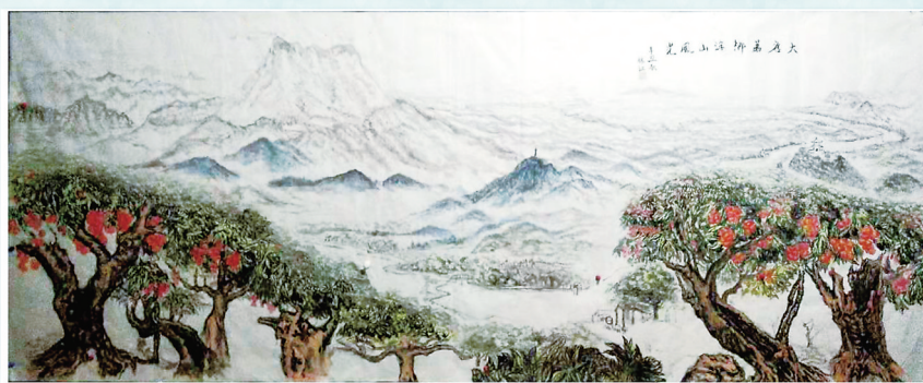
荔乡浮山风光 作者:林江(军旅画家)

此画在“520.我爱荔”第三届根子荔乡美术作品展第二展场(贡园荔谷)展出,展期为5月18日至6月30日。