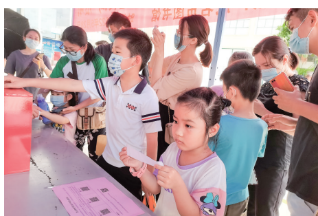
▲ “图书馆服务宣传周”系列活动现场。