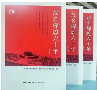
馆藏地点:茂名市图书馆特藏部

茂名,昔日偏居一隅、经济落后的“工矿区市”焕发新机,成长为一座“港、业、城”相互融合、蓬勃发展的开放型现代化产业新城,“向东向南靠海”发展迈出实质性步伐,陆海统筹发展平台不断拓展,发展支撑更加有力。六十年栉风沐雨,六十年沧海桑田,《茂名辉煌六十年》带您一同见证。