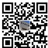
茂名市图书馆 微博