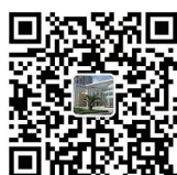
茂名市图书馆 微信公众号