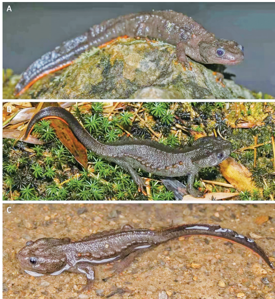
“辛氏疣螈”的不同特征。

在去年的科研调查成果中,云开山保护区科研人员与中山大学王英勇科研团队在广东云开山国家级自然保护区辖区内发现了两栖动物新物种蛙类一种,经过形态学比较和分子生物学技术鉴定,科研团队确定这是一个从未描述过的新物种。其外形和蛙类相似,因其模式标本产地在云开山内,故将它命名“云开角蟾”。科研团队已将研究成果在国际生物分类学专业期刊《动物分类学》上发表。同时,科研人员还将原来在保护区内分布的细痣疣螈进行了重新分类,新种“辛氏疣螈”曾长期被鉴定为模式产地位于广西大瑶山的细痣疣螈,而细痣疣螈的采集人正是时任中山大学生物系主任暨瑶山采集队带头人的辛树帜教授,研究团队遂以辛教授的姓氏为该种命名。辛氏疣螈与细痣疣螈的主要区别特征是:其头长大于头宽;吻部钝圆;四肢贴体相向时指、趾明显重叠;瘰粒小且彼此