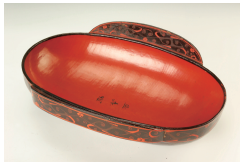
“君幸酒”漆耳杯 湖南省博物馆供图