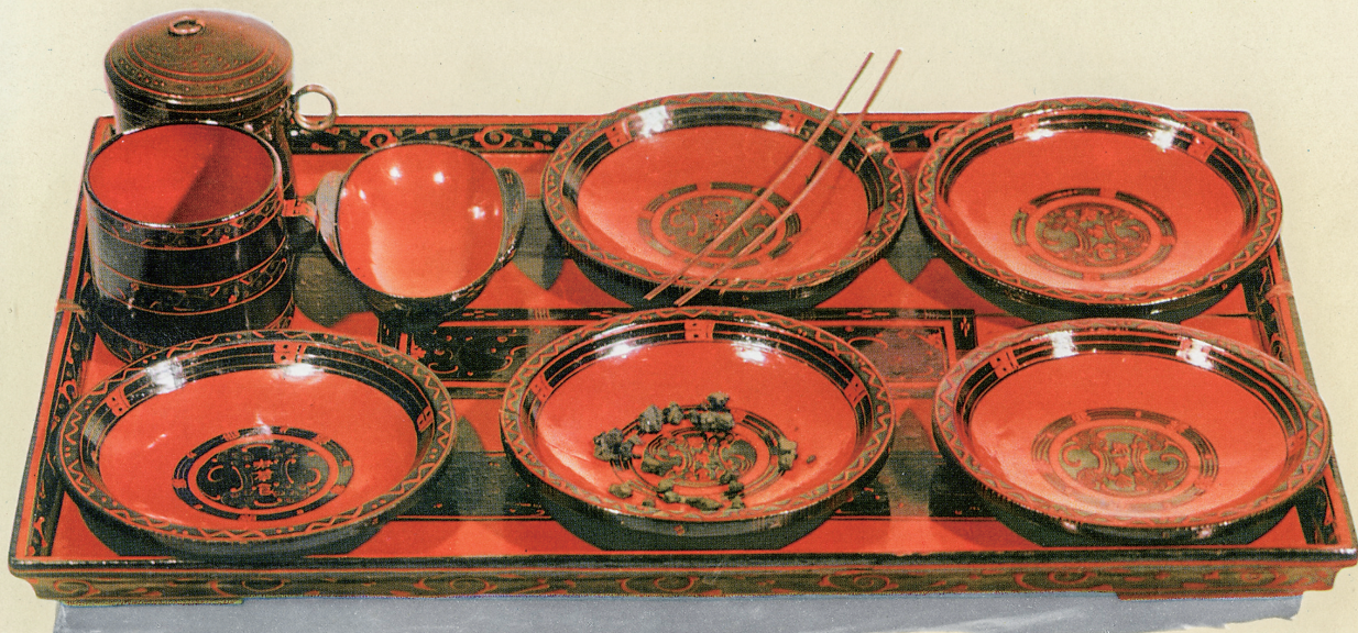
云纹漆案及杯盘

从长沙马王堆汉墓出土的文物可见两千多年前、西汉长沙国丞相、轪侯利苍家餐桌上的“排场”。