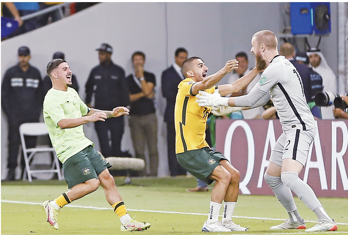
▲6月13日，澳大利亚队守门员安德鲁·雷德梅因(右)与队友在比赛后庆祝。