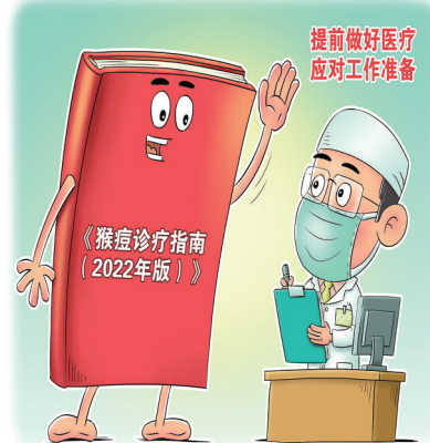
发布指南 新华社发 王琪 作

指南明确,疑似病例和确诊病例应安置在隔离病房。疑似病例单间隔离。患者体温正常,临床症状明显好转,结痂脱落后可以出院。