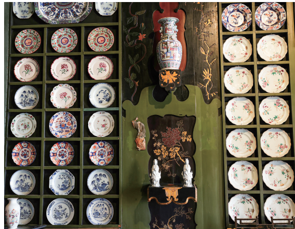
▲这是6月14日在位于法国巴黎的雨果故居拍摄的“中国客厅”内的装饰品细节。