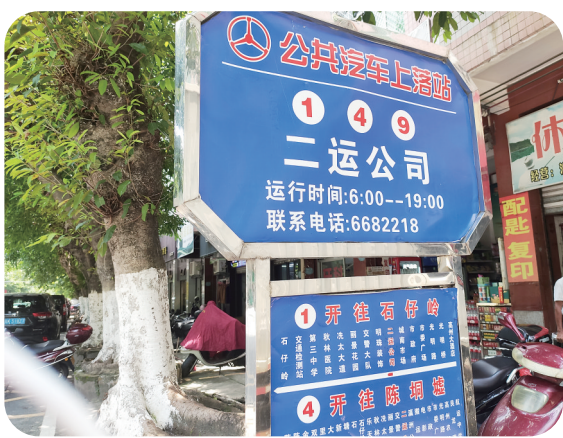
▲“二运公司”站的站牌也没有更新。