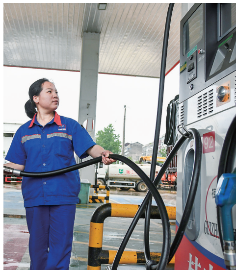
6月28日,湖南省邵阳市城步苗族自治县一加油站的工作人员给汽车加油。