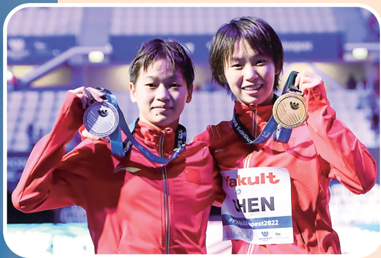
6月27日,陈芋汐(右)与全红婵在颁奖仪式后合影。

新华社布达佩斯6月27日电(记者刘旻、陈浩)2022布达佩斯游泳世锦赛27日进行了女子10米跳台决赛,奥运冠军陈芋汐和全红婵包揽冠、亚军,两人之间总分差只有0.3分。