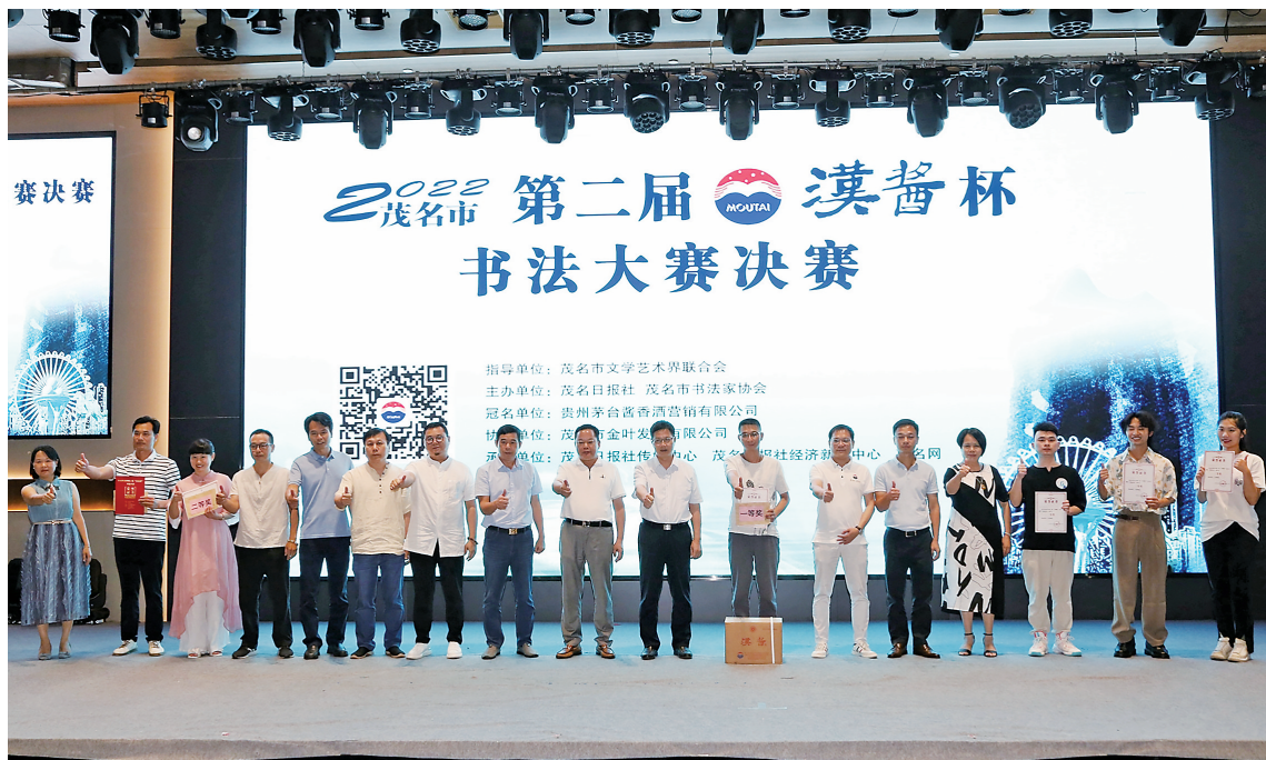
获奖选手与评委嘉宾合影留念。

茂名晚报讯 荔红时节,翰墨飘香。昨日,2022 茂名市第二届“汉酱杯”书法大赛决赛在茂名钧明城举行,38名书法爱好者同台竞技,现场挥毫,评委根据选手作品,现场评出了本次书法大赛的一、二、三等奖以及优秀奖。