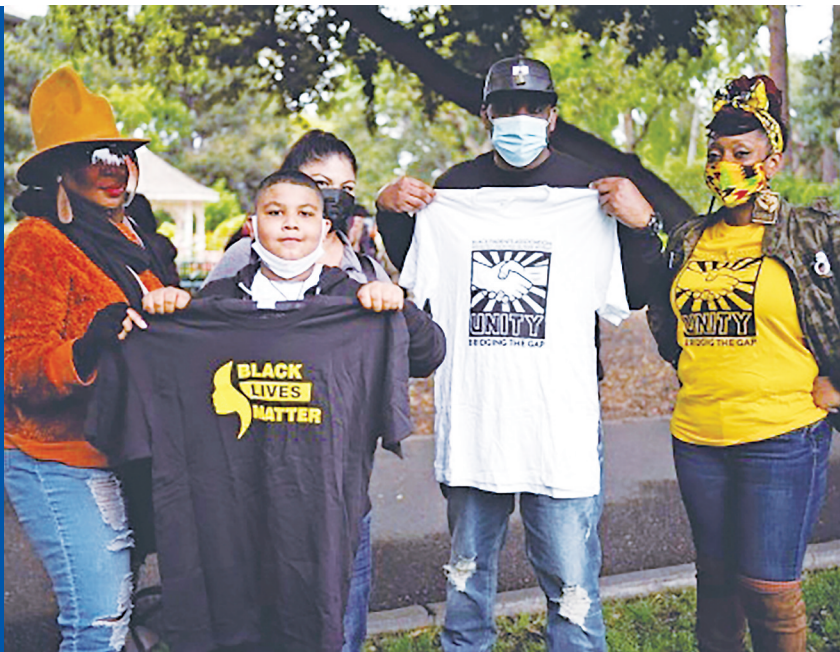
5月15日,在美国加利福尼亚州圣马特奥市,非裔社区代表参加反对种族歧视和仇恨犯罪集会活动。

分析人士指出,弗洛伊德事件两年后,美国少数族裔仍然因为愈演愈烈的系统性、普遍性的种族歧视而深受暴力执法之痛。种族主义痼疾难除,让自诩“民主灯塔”的美国难言公平与正义。