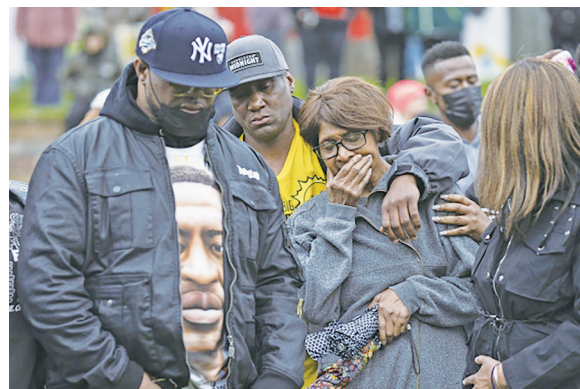
5月25日,在美国明尼苏达州明尼阿波利斯市,弗洛伊德的家人参加哀悼活动,纪念弗洛伊德遇害两周年。

西班牙《国家报》刊文指出,美国历史在一定程度上是种族主义的历史,种族主义“将美国国旗的条纹变成裂痕,将星星变成坑洼”。