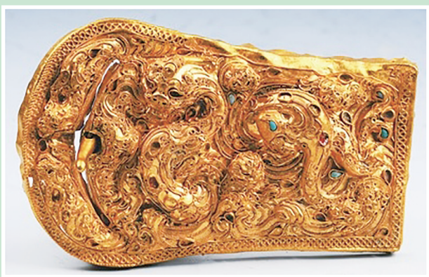
汉代八龙纹金带扣。