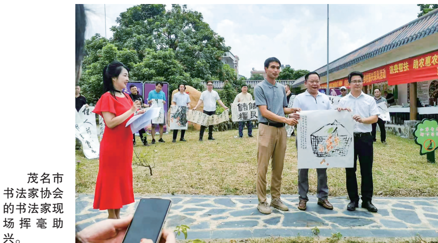
茂名市书法家协会的书法家现场挥毫助兴。

茂名晚报讯 记者郭瑞祥 昨天上午,在高州市分界镇储良村委会杏花村储良龙眼英雄母树下,举行了一场别开生面的“观母树 赏书法 品储良——相约杏花村,邂逅最甜龙眼”直播活动。