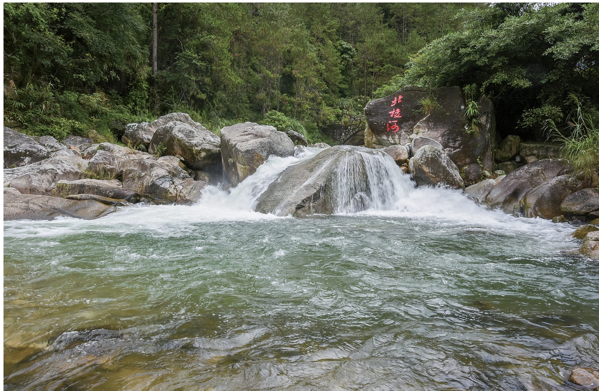
北梭瀑布下游,形成清澈北梭河。

北梭河以它的清凉河水吸引了众多游客前来游玩消暑。据村民介绍,近段时间有大批外地游客来游玩、露营。据记者昨天所见,从村到瀑布的路段虽是硬底化,但路窄会车难,且有三个盘山转角处难转弯,新手司机及较长的车辆转弯有难度,建议不要轻易开车上瀑布,以免造成堵车增添麻烦。从瀑布上方下到谷底,路陡且滑,为了安全亦需注意,非专业人士不宜下到谷底,宜远观瀑布。