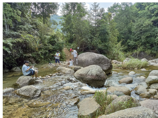
▲瀑布往下汇成溪流,游人在享受夏日清凉。