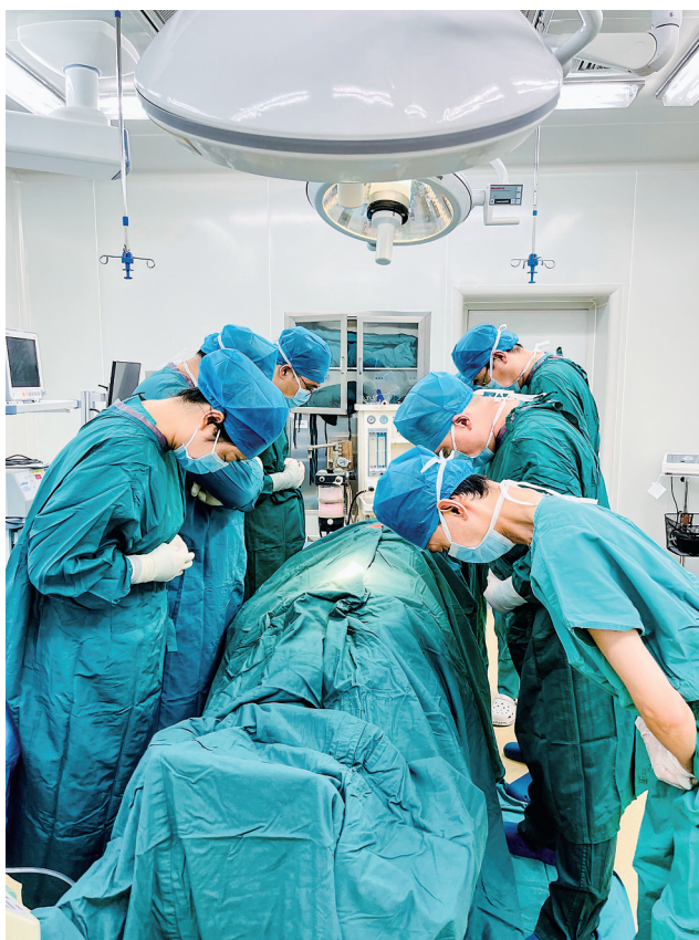
图为医护人员向器官捐献者鞠躬默哀。

国器官捐献志愿登记4916045人,实现捐献人数超过4.1万人,捐献器官个数超过12.3万个。