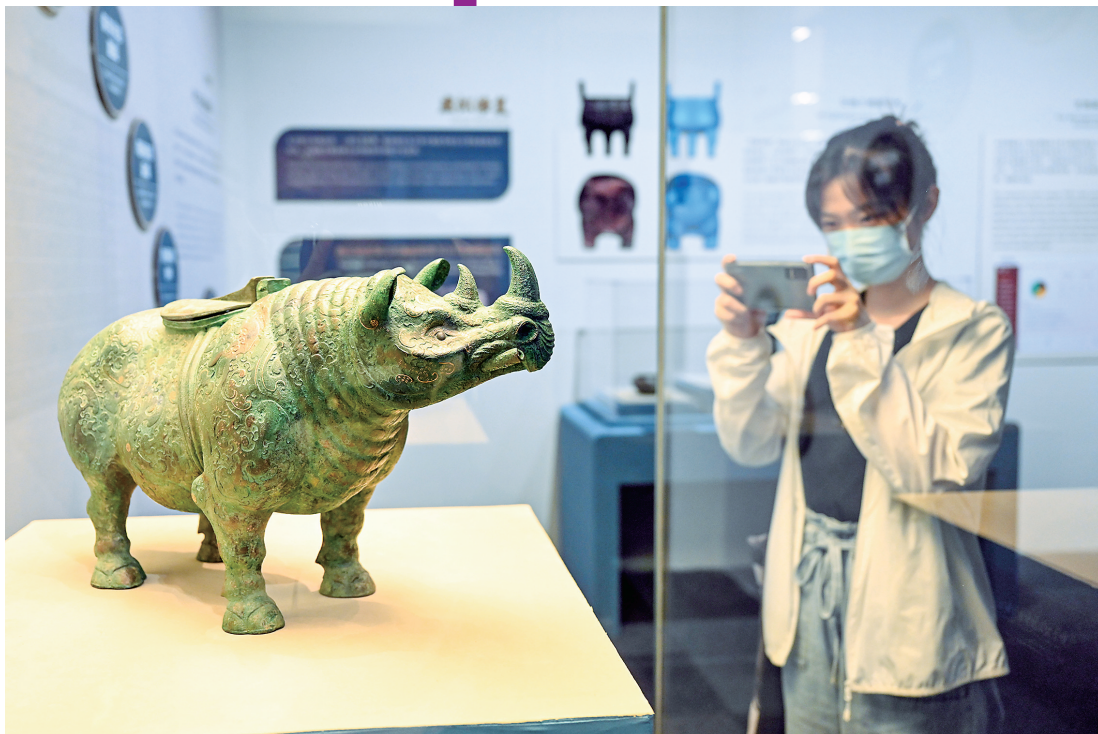
8月10日，观众参观3D打印结合传统工艺仿制的错金银云纹犀尊。