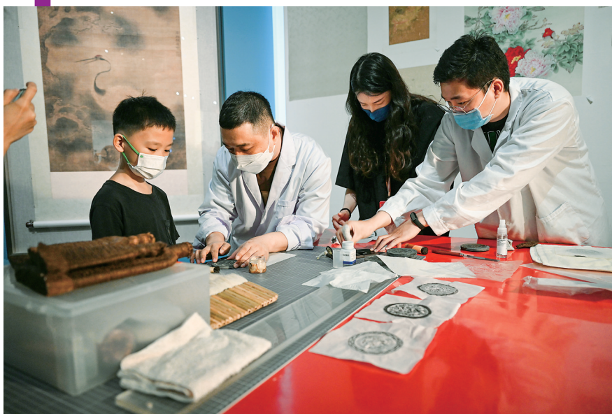
8月10日，国家博物馆工作人员展示金石传拓技艺。