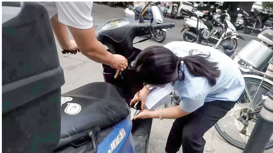
郑州一保险公司人员正在进行现场验车,以确定车辆是否在郑州本地。

保险公司拒保拖延、捆绑销售,摩托车主来回折腾、苦不堪言……国务院第九次大督查第九督查组在梳理国务院“互联网+督查”平台收集的问题线索后发现,不少河南摩托车主对交强险投保难问题反映强烈。