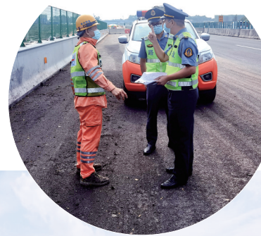
茂湛高速茂名路政中队联合拯救作业单位,实地考察绘制扩建路段绕行路线图。