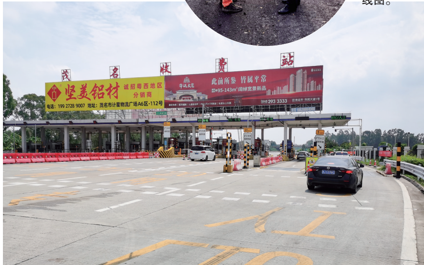
茂湛高速茂名站车辆有序通行。

纽互通立交(K3469+412m)段路肩封闭,路面维持双向四车道通行,限速80公里/小时。路肩封闭下高速公路路面缩窄,通行时请遵照现场交通标志指示,注意减速慢行。