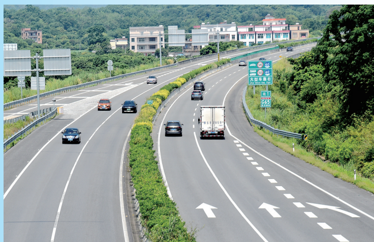
9月12日,中秋假期最后一天,记者在包茂高速茂名段看到,返程车流平稳有序,一路顺畅。

“这是我在异乡的又一个中秋节。虽然,不能陪伴在家人身边,但是我会和他们视频聊天,送上节日祝福。”另一名工人说,尽管不回家过节,但是公司利用空闲时间,为他们准备了丰富的节目,座谈会、篮球比赛等。该公司相关负责人表示,工人们放弃与家人团聚的机会,争分夺秒加速推进,全力以赴确保工程建设顺利完工。各项目部通过开展各种关爱活动,让奋战在一线的工人们在工地上也能感受到“家”的温暖。同时,该公司根据天气情况,及时调整作业时间,确保大家的健康安全。