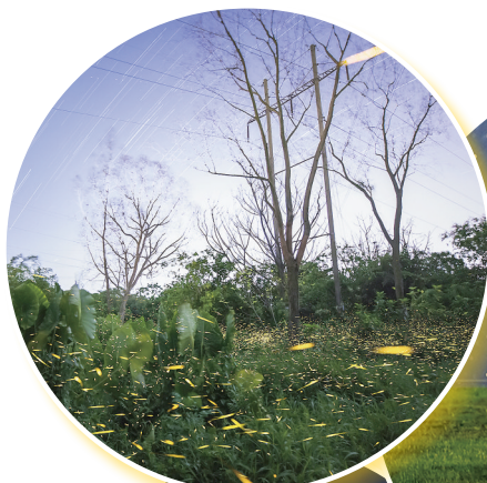
▼茂名小东江《林间萤火》