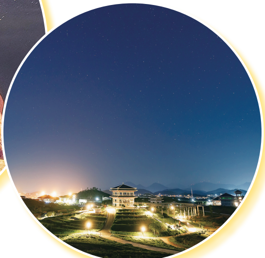
▼中国荔枝产业园星空