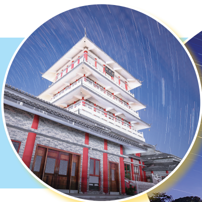
▼潘茂名公园《雨顺阁星轨》