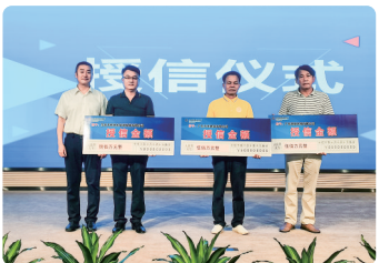
建行茂名市分行为小微企业输送金融活水。