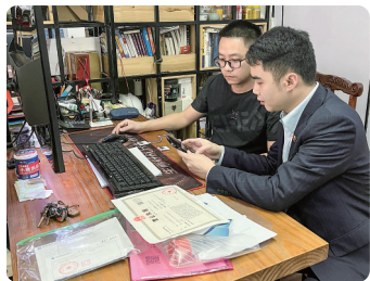
建行茂名市分行普惠金融贷款助力小微企业发展。