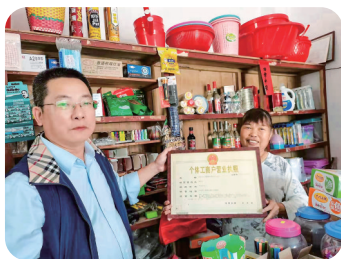
建行“裕农通”打通了乡村金融服务“最后一公里”。