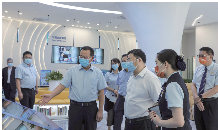
建行茂名市分行以新金融行动全方位服务茂名地方经济建设。

一直以来，中国建设银行茂名市分行把“国之大事”作为“责之重者”，把“民之关切”作为“行之所向”，紧紧围绕市委市政府及监管部门工作要求，对接茂名“十四五”规划及政策方向，坚持以金融的温度和厚度承托地方经济建设和发展，加大对重点项目、中小微企业、制造业等重点领域的信贷支持，为实体经济输送金融活水；用智慧赋能构建特色服务体系，用心服务社会民生提振消费，以新金融实践为茂名高质量发展贡献建行智慧和力量，用优异的成绩迎接党的二十大胜利召开。