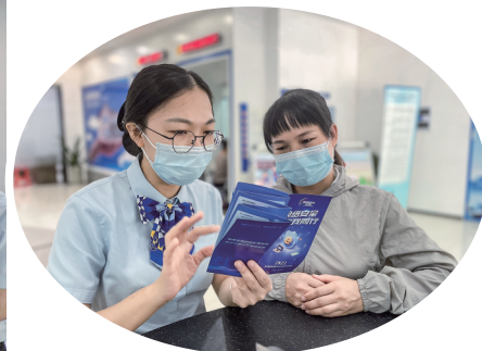
建行茂名市分行积极向市民宣传金融知识守护金融安全。