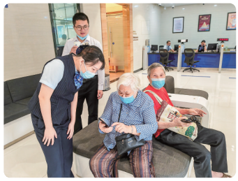
建行茂名市分行“适老”服务有温度。