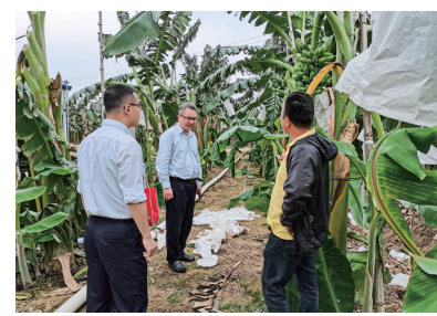
建行茂名市分行走进田间地头服务特色产业，助力乡村振兴。

安居“有保障”，创业“有支持”，消费“多优惠”。中国建设银行茂名市分行用暖心贴心的新金融实践为广大市民筑起金融港湾，守住稳稳的幸福。