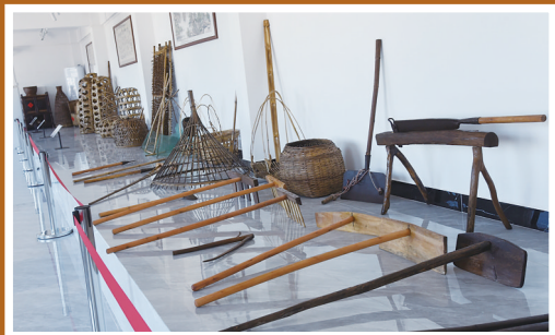
竹木制作的农家用物品