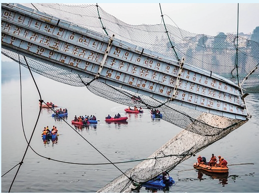
10月31日,救援人员在印度古吉拉特邦的桥梁断裂事故现场搜救。

新华社北京11月2日电 印度总理纳伦德拉·莫迪1日前往两天前在西部古吉拉特邦发生的桥梁断裂事故现场,下令彻查此事。