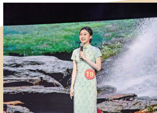
部分选手才艺展示