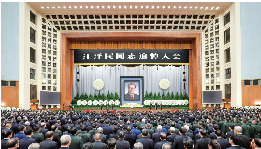
12月6日,中共中央、全国人大常委会、国务院、全国政协、中央军委在北京人民大会堂隆重举行江泽民同志追悼大会。