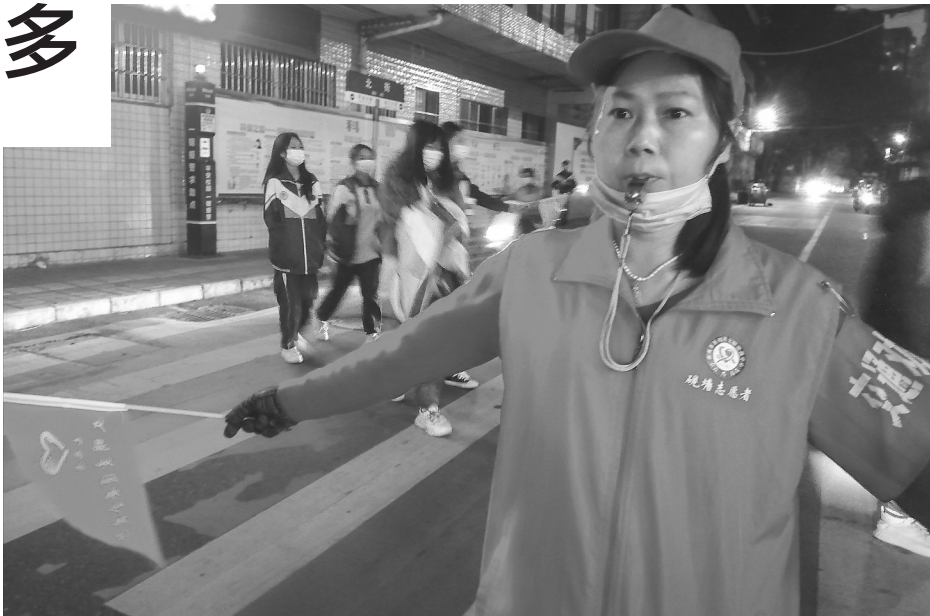
黄女士一早就来疏导交通。

在她的影响下,许多家长们也主动加入到志愿服务团队来。她的儿子每天上学也跟她一起出发,总是最早来到学校学习。