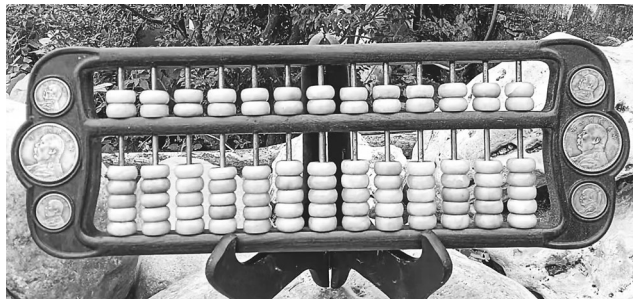
银币算盘。

面刻着“子玉算盘,周懋琦(清)制”的字样。算盘虽小,在算盘正面却有着25级计数单位,比一般的算盘要多,且其梁上的珠子不是2个而是4个的,也与一般的算盘有别,甚为罕见,究竟其用法及用途是怎样的,尚待考究。