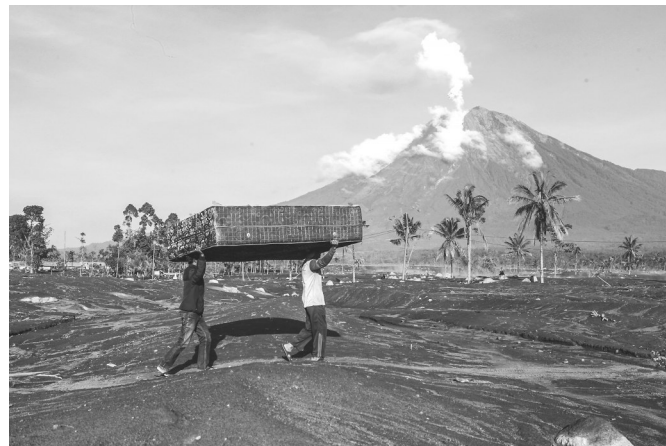
这是12月4日在印度尼西亚东爪哇省卢马姜的萨皮朗朗村拍摄的塞梅鲁火山喷发后影响的区域。

新华社北京12月6日电 印度尼西亚爪哇岛东部塞梅鲁火山4日凌晨开始喷发,5日喷发剧烈程度有所减弱,但是火山灰遇雨水形成泥石流的威胁较大,已有2400多人紧急疏散。