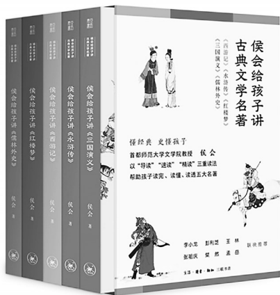
《侯会给孩子讲古典文学名著》 侯会 著 三联书店

去博物馆和名胜古迹的时候,若有好导游讲解,观感会大不相同,许多不曾注意的细节和历史背景让游览变得丰盛厚重起来。好的讲解员会关联历史和现实,既旁征博引又融会贯通,融入生活体验来解疑答惑,让人印象深刻并产生求知欲的浓厚渴望。