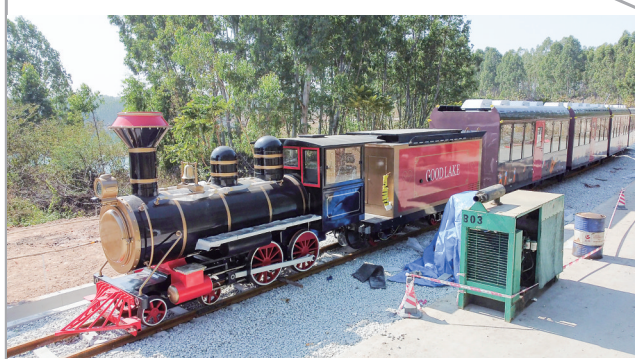
观光火车车头为蒸汽机车造型。