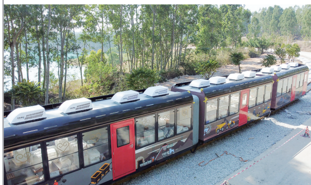
火车车厢外面印有工人采矿的卡通图案。