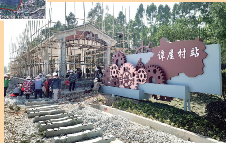
建设中的谭屋村站。