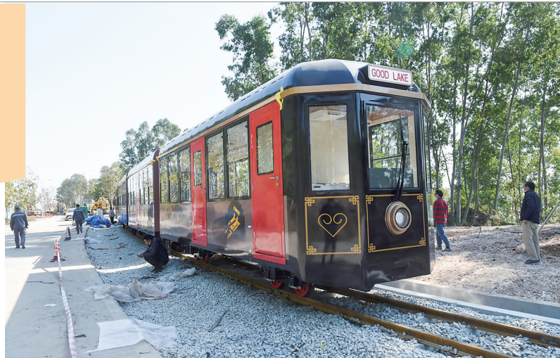
复古的观光火车已经安装完毕,静静地停在铁轨上。