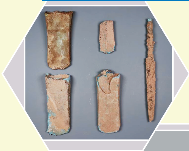
调查队在东圳水库采集的青铜器照片。