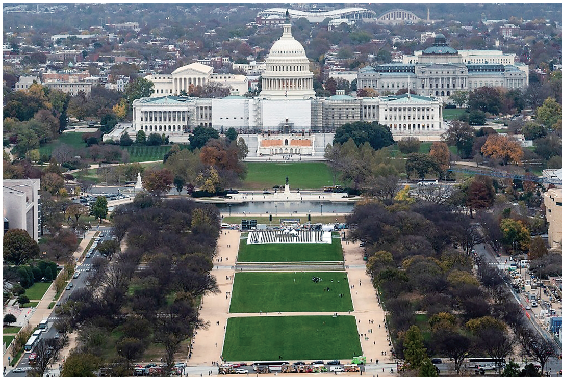
这是2022年11月10日在美国首都华盛顿拍摄的国会大厦。

在曼格看来,最重要的改进是提升国会警察局招募和培训新警员的速度。当大多数执法机构苦