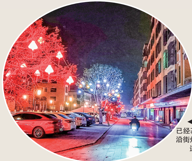
◀ 金塘镇乾街已经基本建设完成,沿街灯饰首次亮灯。

穿过艺术稻田,湖泊,树林,菜园,庄园,微型加工厂,村史馆,骑楼街……这样的一步一景,令人赏心悦目。油城墟沿线乡村振兴下的新农村风貌在灯光的映照中,显得格外温馨。这样璀璨浪漫的油城墟,即将成为茂名又一打卡地。随着项目的即将建成,游客可以到油城墟感受一下我市的历史变迁,还有茂名传统的乡村风情。