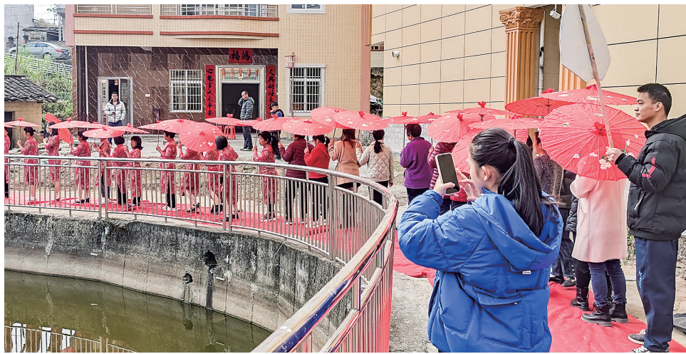
立模村外嫁女集体回娘家。