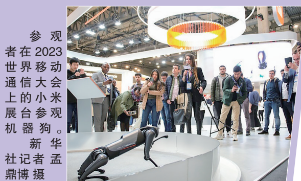
参观者在2023世界移动通信大会上的小米展台参观机器狗。