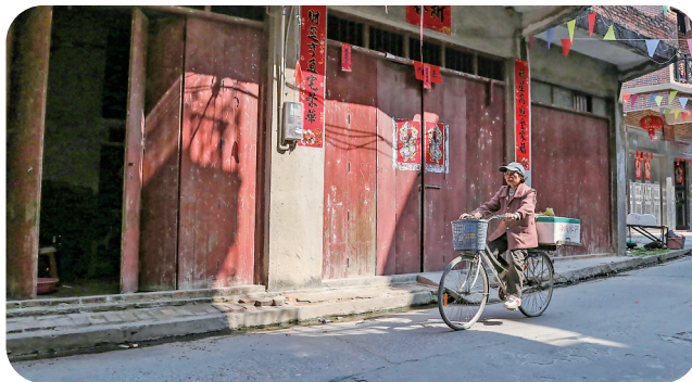
南安圩传统木门和门神对联。