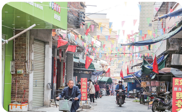
历史悠久的南安圩依然保留了圩日。

由于犀湾人口发展，人们对商品的需求量也迅速增加，因此很快就在犀湾旁边的大坪地上，自然形成了一个集市，称南安圩。每逢圩日，都有人把鱼虾及柴米油盐等生活用品挑到南安圩卖。南安圩的集市功能一直延续至今。据村中干部介绍，南安圩成圩该有600多年了。