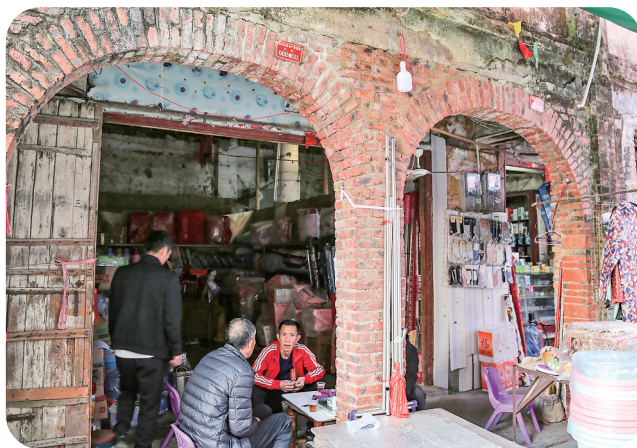
南安圩保留了部分骑楼特色建筑。

南安圩，昔时“水泄不通”般的圩日繁华虽远去，其历史文脉仍存，目前仍有经济功能较齐的商店，有一间中学、一家银行，跑着通往城区的班车，仍不失是当地乡村的一个小经济、文化中心。