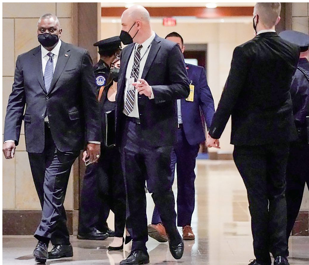
2022年2月2日,在美国首都华盛顿,美国国防部长奥斯汀(左一)准备在国会出席一场听证会。

在那名国防部官员看来,伊拉克领导人“和我们一样希望伊拉克不要成为美国和伊朗冲突的场所”。(郑昊宁)