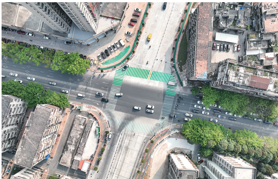
▲大园三路余段正式通车。