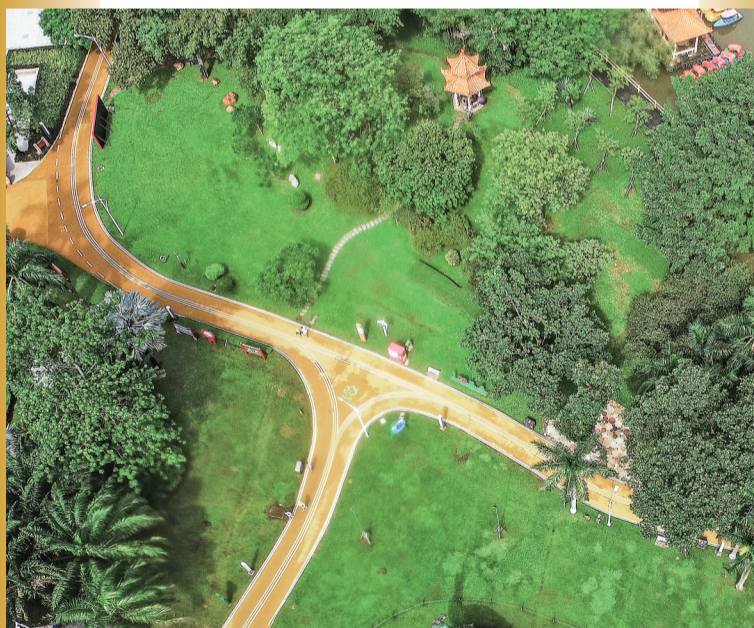
茂名好心绿道贯通中心城区。