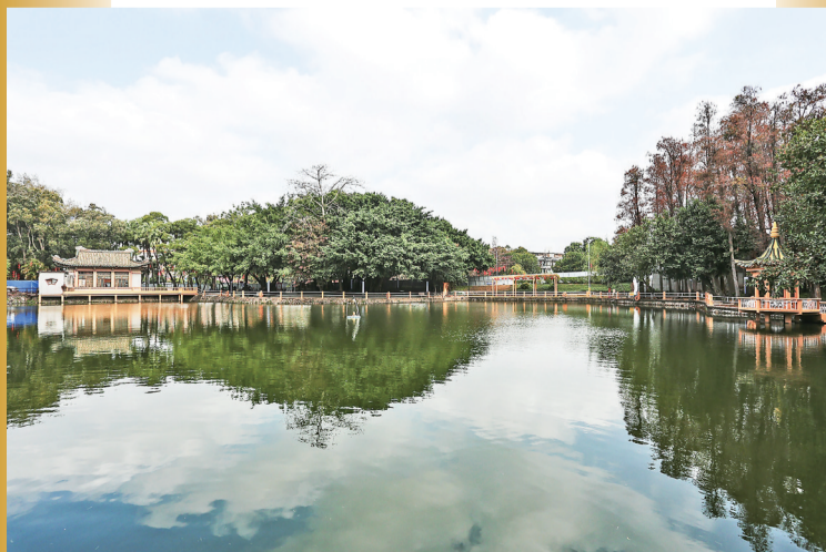
江滨公园升级改造后,湖畔景色怡人。