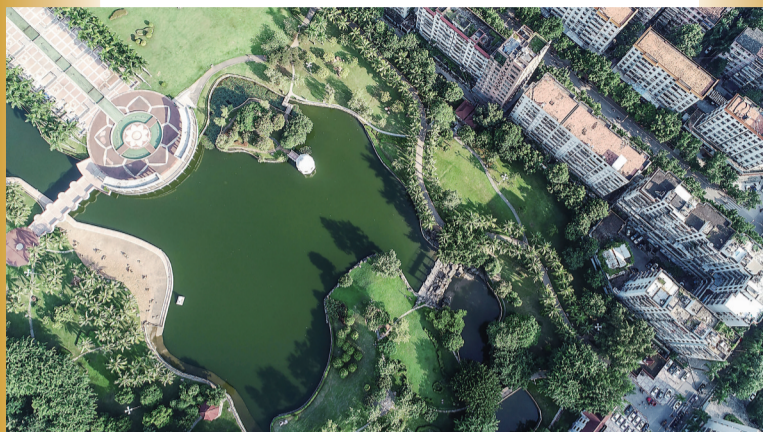
人民广场水体整治后变得水清岸美。