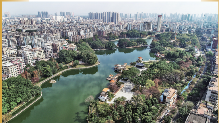
新湖公园水体整治后变得湖水清澈绿植葱茏。