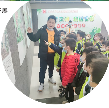
■ 正在给小读者们讲解展览的内容