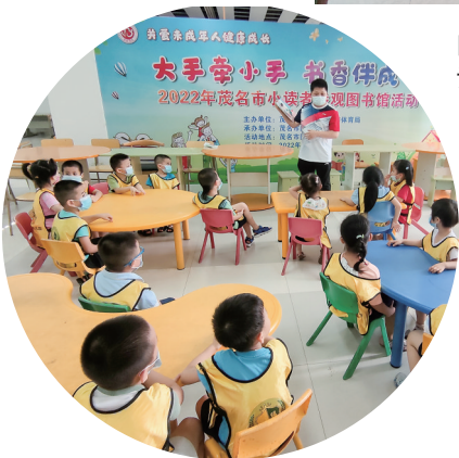
■ 带领小读者开展参观图书馆活动