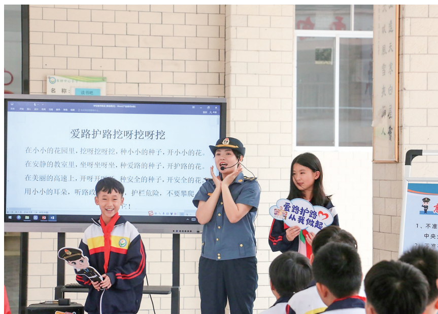
路政版“挖呀挖”走进朱砂中心小学。

据统计,茂湛、包茂高速路政宣传月活动期间,共发动近300人次,开展现场走访60余次,发放宣教资料3000余份、布设广告画/展板30余幅,为300多人次提供咨询服务,有效增强群众爱路护路意识,提升路政管理认知度,也为推动道路交通安全社会共治奠定良好的基础。