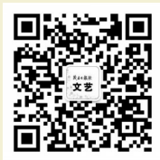
快捷投稿 扫码关注

多彩的霞光知道化橘红的精妙 它能延伸出无限韵味的风景 延伸出文化无限的魅力 从北向南 从高岭到堤岸 簇拥着橘州大地 装点了化州多姿多彩的后花园 化橘红到嘴方知润 化橘花沁肺满香春 离开礞石,化橘红长不出软绵绵的绒毛 罗仙是化橘红的伯乐 绒毛是化橘红的精华 尖岗岭升起了祥云 禅性的化橘红 许你一春芳意,三月如风,四季放歌 千年沉淀的底蕴 将在新世纪厚积薄发