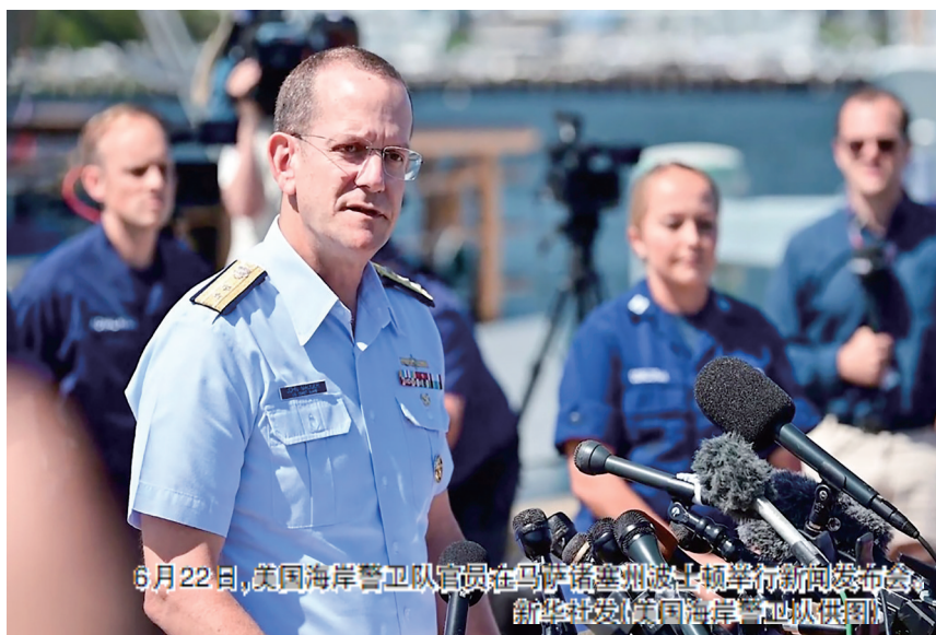
6月22日,美国海岸警卫队官员在马里亚纳群岛华盛顿州举行新闻发布会,向媒体通报“泰坦”号潜水器失联消息。

等自然景观,而“泰坦尼克”号残骸在水下3800多米处。美国海洋技术学会下属载人潜水器委员会主席威尔·科嫩说,目前全球约有10艘深潜器设计能力达到这一下潜深度,而其中只有“泰坦”号未经过美国海运局、欧洲DNV公司等第三方机构认证。