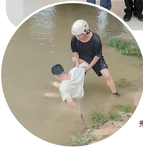
◀黄青玉两次潜入水中把梁先生救上岸。茂交宣